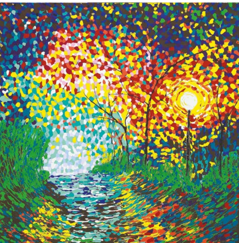
Nocturnal Glow 夜光 (2021) Acrylic on canvas (布面丙烯) 110cm x 110cm x 7.8cm

罗利永也希望透过自传强调感恩和谦逊的重要性。“我希望激励他人，特别是我的孩子们，回馈社会并激发他们帮助那些出生在恶劣环境中的贫困人口的热情。我的